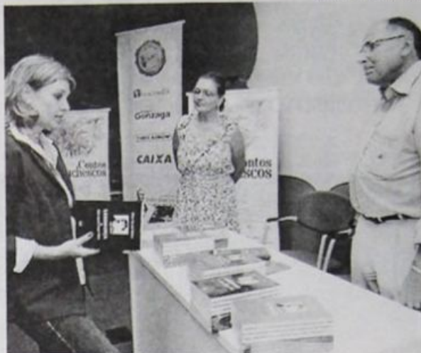
ENCONTRO do Instituto João Simões Lopes Neto

A casa em que morou João Simões Lopes Neto, entre junho de 1897 a junho de 1907, fica localizada na Rua Dom Pedro II.