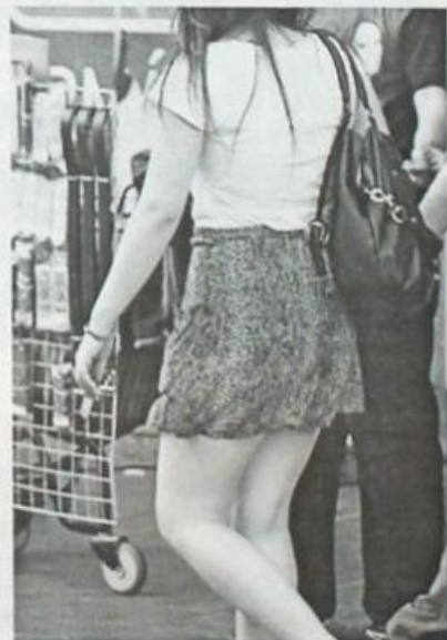
HOJE é sábado... dia de saias curtas

O décimo copo, eu peguei a garrafa no resto e me joguei na pia. (Hi...Hi...Hi...)