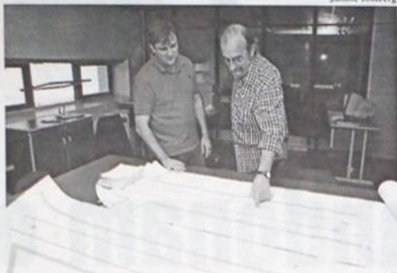
PROJETO já está definido