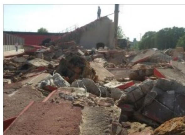
Demolição parcial do Estádio Bento Freitas – Fotos:HFJ/DM