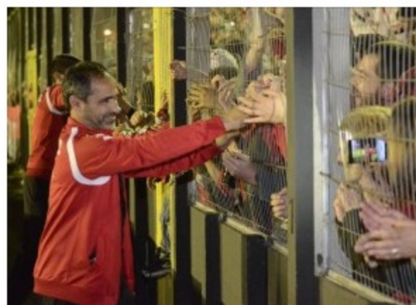
Chegada do Brasil – Acesso Série B